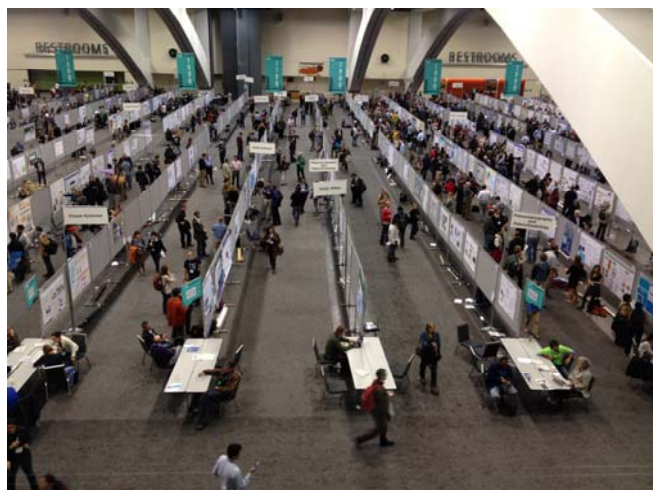
写真2 ポスター会場